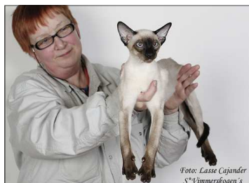
Dagny Dickens Sverige AB, WCF